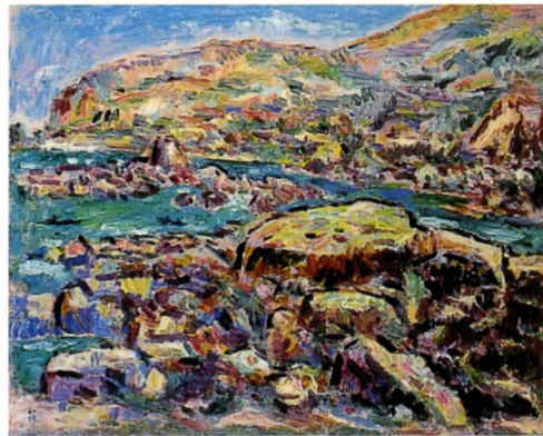
《春の海》1974年 山口県立美術館蔵