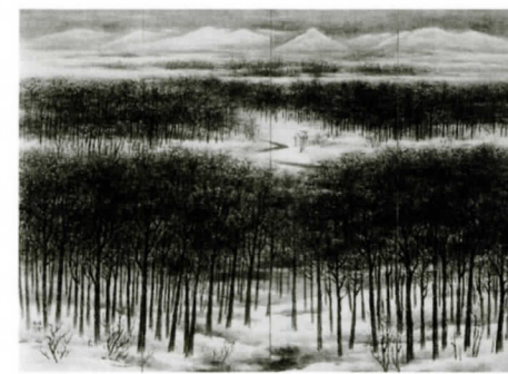
渡瀬凌雲 《雪原(ミシシッピ源流)》1976年