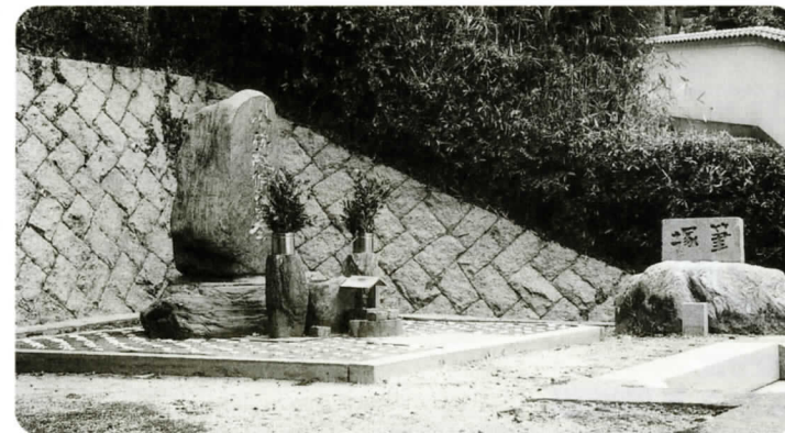
尾道西国寺の墓碑と筆塚 (写真3)