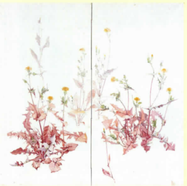
雑賀清子《秋ののげし》 1983(昭和58)年 熊野古道なかへち美術館蔵