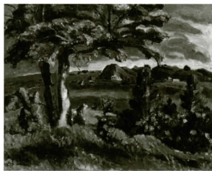
鍋井克之《熊野灘のみえる丘》1963(昭和38)年 田辺市立美術館蔵