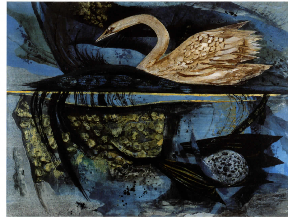
稗田一穂《水影》 1962(昭和37)年