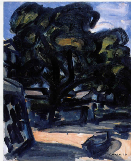
原勝四郎《瀬戸風景》 1935(昭和10)年 田辺市立美術館蔵