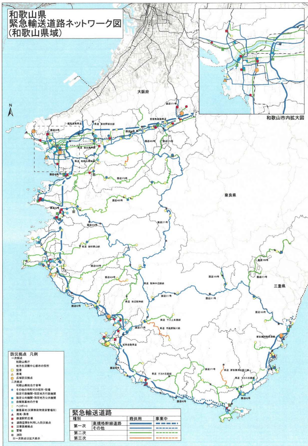
資料2-8 緊急輸送道路及び緊急輸送道路を活用するための道路図 【予-6-1】