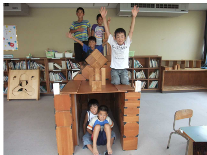
お城をつくったり♪♪