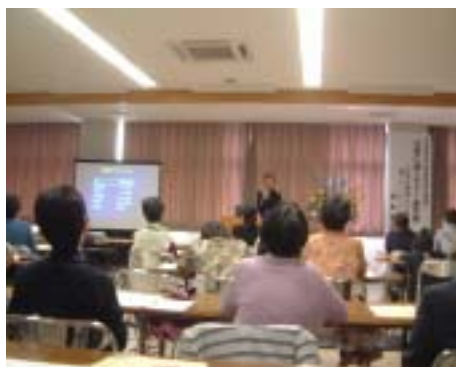
4月に開催した男女共同参画推進員企画講座の様子