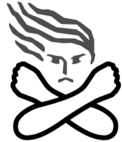
女性に対する暴力根絶のためのシンボルマーク

PTSDは、地震・火事などの災害、戦争、事故、暴力や犯罪被害などによる強烈なショック体験や強い精神ストレスがこころのダメージとなり、時間がたってからもその経験に対して強い恐怖を感じるものです。その症状には、①突然つらい記憶がよみがえるフラッシュ・バック ②常に神経が張りつめて過敏な状態が続く過覚醒 ③記憶を呼び起こす状況や場面を意識的・無意識的に避ける回避や精神的な麻痺 などがあります。