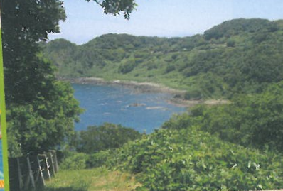
クアの道・木ノ浦