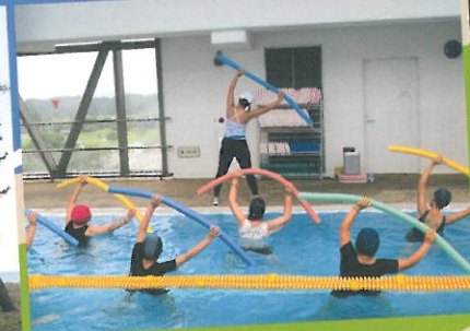
スポーツクラブ「ウェーブ」