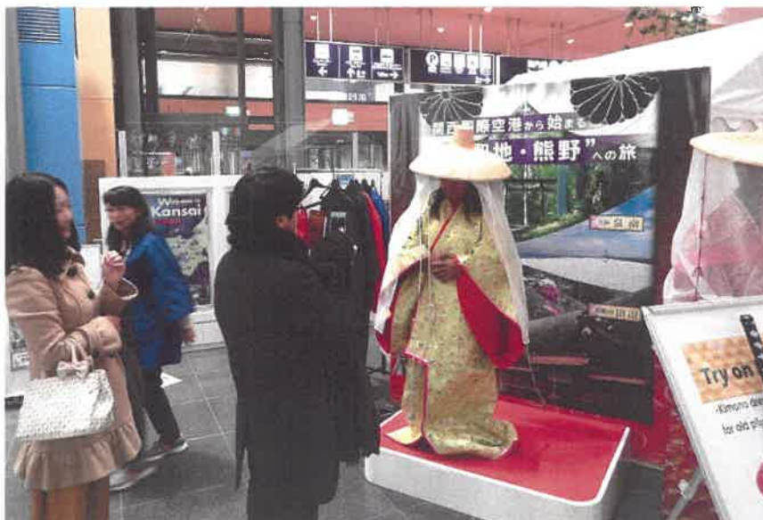
着付け体験 (平安衣装)