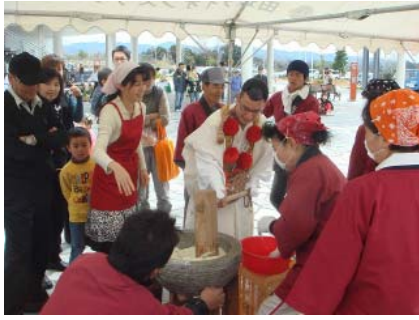
市民活動まつりの風景

具体的な施策としては、市民活動に対する財政的支援措置である「みんなでまちづくり補助金」制度や、様々な市民活動を支援するための拠点である「田辺市市民活動センター」を設置するなど、市民活動に対する総合的な支援体制の整備に努めています。今後も、市民活動団体の皆様方とともに、よりよい市民活動の推進に向けて努めていきたいと考えています。