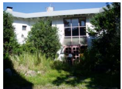
旧中辺路国民宿舎

です。しかし、現実的には施設の状況、合併以前からの検討課題を踏まえると、多額の費用が必要となることから、大変難しいものであると考えています。 また、更地にした上での今後の活用策も含め、施設のあり方については、今後とも十分検討していきたいと考えています。