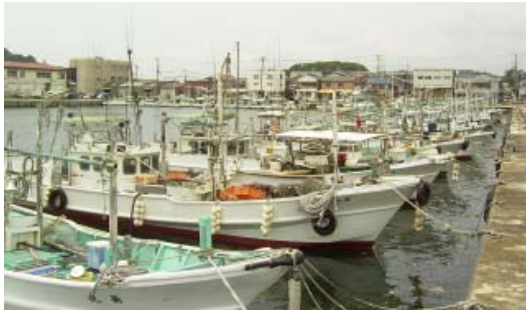
出港を控える漁船

答 ここ最近の原油高騰は著しく、市内漁業者にとっては、漁獲が多い時期は通常通り出漁しているものの、それ以外の時期は漁を控えている状況ですが、まき網漁においては、魚の量を確認するた