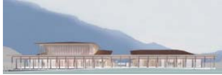
（仮称）本宮ビジターセンター完成予想図

工事請負契約の締結について （仮称）本宮ビジターセンター建築工事の請負契約を締結するもの。