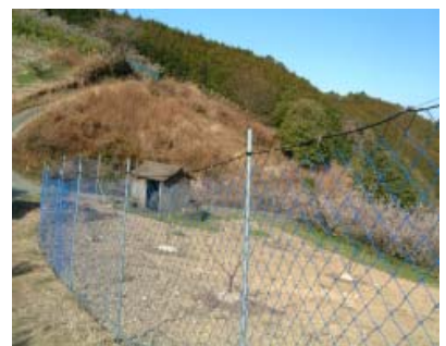
有害鳥獣害対策「防護柵」

農業を守り振興していくためには、鳥獣害対策を含めた農地開発は重要な課題であると認識しています。