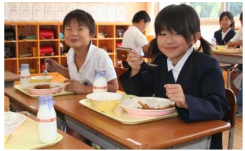
学校給食を食べる子供たち

するためには教育委員会と学校や保護者等との連携を強化することが重要であると考えています。