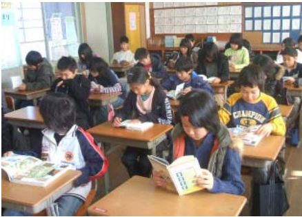
学校での学習風景

答 現在、市内小学校の半数近くに複式学級があり、近年の出生数を見ても児童生徒数がますます減少することが見込まれます。今後、学校としての機能を十分に果たすことが困難なところが出てくることも予想されます。市としては、適正な学校規模や校区編制等を総合的に検討する委員会を早急に設置し、今後のあり方についての基本方針を策定していきたいと考えています。