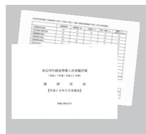
田辺市行政改革第1次実施計画

民の皆さんのご理解を得ながら、さらにもう一歩踏み込んだ改革を進めていきたいと考えています。