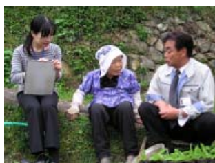
行政局職員による「声かけ運動」

答 行政局単位で実施している「声かけ活動」は行政と住民との情報交流の場を創出するとともに、各地域の様々な課題をお聞きする貴重な機会です。