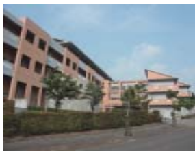
田辺市高齢者複合福祉施設「たきの里」

答 市では、特別養護老人ホームなどの介護施設への入所待機者数が多数いる実情から、施設整備の必要性については十分認識しています。