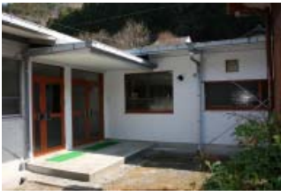
龍神山路紙保存伝承施設

田辺市龍神山路紙保存伝承施設条例の制定について 龍神村安井に新たに龍神山路紙保存伝承施設を設置するため制定するもの。