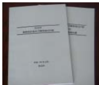
田辺市障害者計画及び障害福祉計画

設から一般就労へとつながった人数の数値目標が、達成又はほぼ達成できることになったことと、地域生活支援のための相談体制の充実を図るため、「田辺市障害児・者相談支援センターゆめふる」を設置した点です。