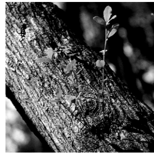
田辺市の木 「うばめがし」

中心市街地からは、京阪神地域や関西国際空港に約1時間30分、首都圏には飛行機で1時間という時間距離で結ばれています。また、高速道路の南伸によって、大阪都市圏とは更に時間距離が短縮されるなど、自然や歴史などの資源が豊かな山村地域と、県南部の都市的機能の中核を担う当市は、「新地方都市」として飛躍する可能性を秘めています。