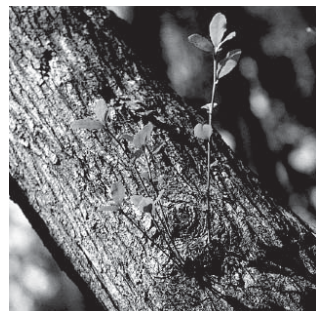
田辺市の木 「うばめがし」

中心市街地からは、京阪神地域や関西国際空港に約1時間30分、首都圏には飛行機で1時間という時間距離で結ばれています。また、高速道路の南伸によって、大阪都市圏とは更に時間距離が短縮されるなど、自然や歴史などの資源が豊かな山村地域と、県南部の都市的機能の中核を担う当市は、「新地方都市」として飛躍する可能性を秘めています。