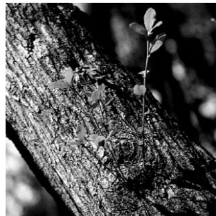
田辺市の木 「うばめがし」

中心市街地からは、京阪神地域や関西国際空港に約1時間30分、首都圏には飛行機で1時間という時間距離で結ばれています。また、高速道路の南伸によって、大阪都市圏とは更に時間距離が短縮されるなど、自然や歴史などの資源が豊かな山村地域と、県南部の都市的機能の中核を担う当市は、「新地方都市」として飛躍する可能性を秘めています。