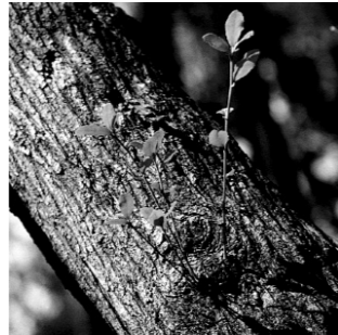
田辺市の木 「うばめがし」

中心市街地からは、京阪神地域や関西国際空港に約1時間30分、首都圏には飛行機で1時間という時間距離で結ばれています。また、高速道路の南伸によって、大阪都市圏とは更に時間距離が短縮されるなど、自然や歴史などの資源が豊かな山村地域と、県南部の都市的機能の中核を担う当市は、「新地方都市」として飛躍する可能性を秘めています。