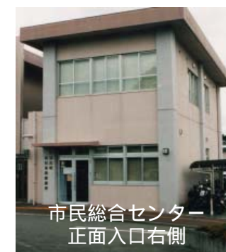
市民総合センター 正面入口右側

小児科のみ、土曜日の夜間の診療を行っています。 診療受付時間 午後6時～9時30分