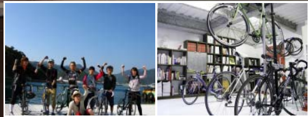
自転車好きで結成したサイクリングチーム (O.S.C) 月1ペースでサイクリングを楽しんでいる。