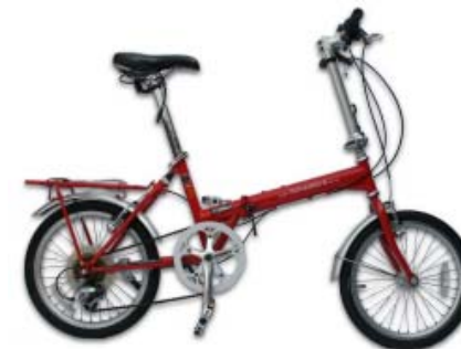
03 Mini Velo

03 ミニベロ 20インチ前後の小径タイヤを装備した自転車をミニベロと呼んでいます。折り畳み車など、いろいろなタイプがあります。こぎ出しが軽く、キビキビとした走りが最大の特徴で、頻繁に停車する局面でも活躍します。また、小径タイヤにより車体の保管がやすく、便利です。