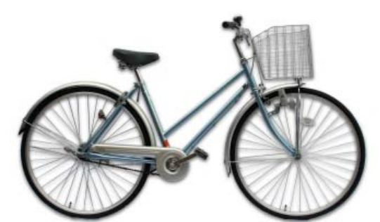
04 City Cycle

04 シティサイクル 短中距離、低中速走行向きの自転車で、最も一般的な車種です。乗りやすく、かごなどが利用でき、また、カギを標準装備する車種が多く、駐輪に困らないことなどから、多くの人に利用されています。これらの便利さから、シティサイクルをサイクリングに使う方もいます。