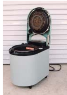
各種生ごみ処理機器の購入費を一部補助します

市では、各種生ごみ処理機を購入する場合、購入費の一部を補助します。処理機を購入する前に、指定の申請書に必要事項を記入の上、廃棄物処理課まで提出してください。処理機を使用することで、各家庭で簡単に生ごみ減量が図られ、生ごみを堆肥として再利用することができます。 交付要件 市内に住所を有する世帯の世帯主が、市内の販売店で処理機を購入し、市内に設置する場合 補助対象機器 密閉式ハケツ容器、コンポスト容器、電気式生ごみ処理機 補助金額 本体価格（購入価格から消費税及び配達料等を除く額）の二分の一以内で上限は二万円（百円未満は切り捨て） 補助対象個数 一世帯につき一基 予算の範囲内で先着順となります。