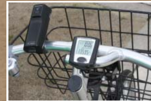
走った距離や消費カロリーを計算してくれるお気に入りのサイクルメーター

3年前にロードバイクを購入してからは、移動手段としてだけでなく、休日にもサイクリングを楽しむようになったとのこと。「以前は月1回くらいロードバイクで出掛けていましたが、最近あまり行けていません。春になったのでまた始めたいです。」と話してくれました。