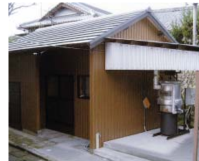
ウッドボイラーを活用した浴室の整備事業

補助対象事業 平成二十一年四月一日から平成二十二年三月三十一日までの間に、民間が所有する用地に公共性の高い施設等を整備するハード事業で次のすべての要件に該当するもの ① 田辺市の各地域の自然資源、文化資源又は歴史的特性を生かして行う施設等の整備又は公益に寄与する施設等の整備を行うこと ② 地域の活性化につながる施設等の整備事業であり、地域の合意が得られるものであること ③ 地域の住民に限らず、広く市民が利用又は参加できる開かれた施設等の整備事業であること