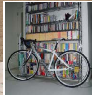
「乗るぞ」というときは白のロードバイク