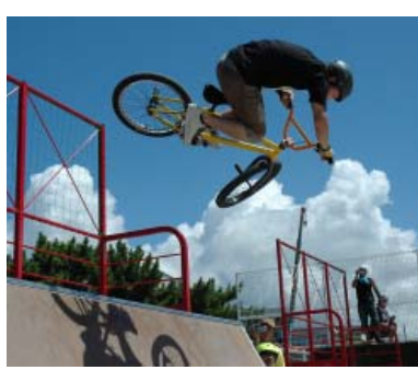
BMXのデモンストレーション（扇ヶ浜フリースタイルフェスタ）

設等の整備事業であること ④ 施設の整備後は、少なくとも五年間は同じ目的に利用されること ⑤ 施設の維持管理については、補助対象者の責任において実施すること 補助金額 補助対象経費四分の三以内の額で、百万円を限度に補助。ただし、対象事業が国、県等の補助金を受ける場合、補助対象経費は、その補助金の額を差し引いた額になります。 その他、補助対象とならない経費があります。 事業実施補助 補助金額 補助対象経費四分の三以内の額で、百万円を限度に補助。ただし、対象事業が国、県等の補助金を受ける場合、補助対象経費は、その補助金の額を差し引いた額になります。 その他、補助対象とならない経費があります。 事業実施補助