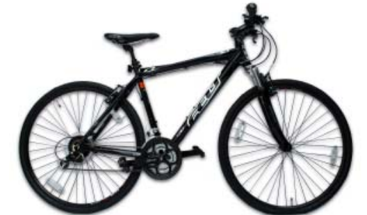
02 Cross Bike

02 クロスバイク ロードバイクの軽快さとオフロードを走るためのMTB（マウンテンバイク）のタフさを掛け併せた街乗り専用の自転車です。タイヤは太すぎず、また、ハンドル位置が比較的高いので、リラックスした乗車姿勢になります。初心者でもすぐに乗りこなせるのが、最大の利点です。