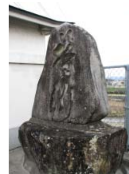
淵のそばに建つ碑

かに水面がざわめき、渦が巻き出した。と思ううちに、大入道が立ち上がり、侍目掛けてつかみかかってきた。腰の一刀抜く手も見せず切りかかるかと思いきや、侍は一目散に逃げ出した。大入道は目をむいて「卑怯者、待て、待て」と岸に跳び上がって追いかけた。侍は、逃げながら何やら粉のような物を振りまいた。「今に見ておれ、参るぞよ」と逃げ回って一生懸命粉をまき続けた。そのうちに大入道の速度がにぶくなり、バタリと倒れて動かなくなった。翌朝人々が来てみると、辺り一面に糠がまかれ、糠にまみれた大鯰が死んでいた。それ以後大入道は現れなくなったという。 「熊野中辺路 伝説(下)」くまの文庫より