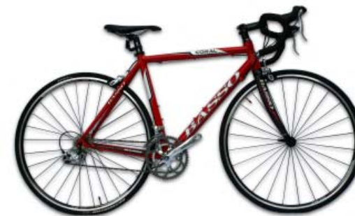
01 Road Bike

01 ロードバイク 舗装された路面での走行性能は、他の車種と比べて最も優れています。元がレース用とあって、速く走るならこれ以上のものはありません。ただ、高速巡航を前提とした乗車姿勢は、のんびり走るには向きません。走ることで、それ自体を楽しむにできる人こそ満足できる車種だと言えます。