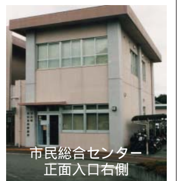
市民総合センター 正面入口右側

小児科のみ、土曜日の夜間の診療を行っています。 診療受付時間 午後6時～9時30分