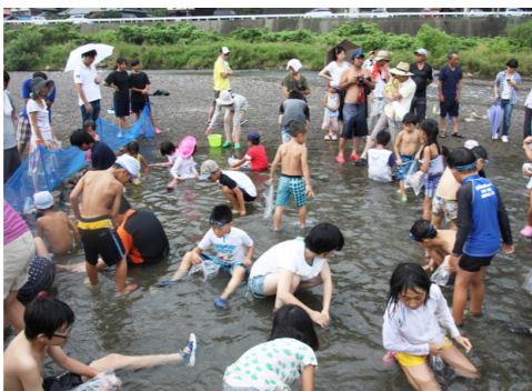
▶昨年の魚のつかみ捕り体験と花火の様子

さこい踊り、討論会、大塔花火大会 場各種体験教室については、7月19日(火)～29日(金)に左記へ電話でお申し込みください。 「先着」 詳しくは、プログラム冊子又は大塔観光協会ホームページをご参照ください。 場大塔地球元気村実行委員会(大塔行政局 産業建設課内) ☎0739(48)0301 ☐http://www.aikis.or.jp/~otomura/