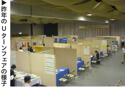
▶昨年のUターンフェアの様子