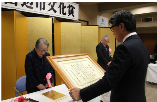
▶昨年の授賞式の様子

http://www.city.tanabe.lg.jp/hisho/index.html