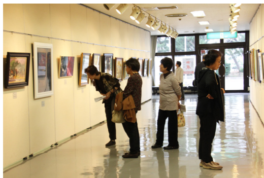
▶昨年の市展の様子

までに、左記へ住所・氏名・電話番号・格花、盛花の別をはがきにご記入の上、お申し込みください。(45名を超えた場合は、抽選となります。) 活け込みは、10月6日(日)の8時40分～12時に紀南文化会館4階「小ホール」で行います。 なお、本展覧会から、陶芸部門は工芸部門に統合されました。 ※工芸(陶芸・染織・漆芸・木竹工・パッチワーク等) ■文化振興課文化振興係(市民総合センター3階) 〒646-0028 高雄一丁目23-1 ☎0739(26)9943