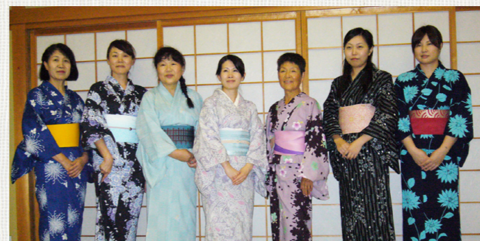
文・写真 中野永実子

必撮!! 市民レポーターが、地域情報を発信★ まちかど特派員 2日間で見事な着こなし ご覧いただいている写真は浴衣の着付講座の最終日に撮影されたものです。(一番左が講師の先生、6人は生徒さんです。) 皆さん、ご自分の着付けでの記念撮影です。こんな風に自分で浴衣を着たら...と思われている方が多くいらっしゃるのでは...と取材に出發。 お邪魔したのは「浴衣の着付講座」。新庄公民館、授業は2日間です。(本年度分は既に終了) 難しそうな気がする帯の結びは、身体の前で蝶々を作ってから背中に回す着方を教えていただきました。皆さん、一人で浴衣の着付をマスターしていました。 2日間の講座でしたが、写真のような見事な着こなし。講座は楽しい雰囲気とともに終了しました。