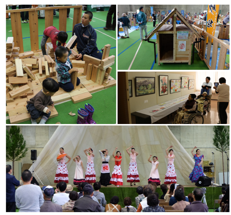
木に親しむ催しがたくさん