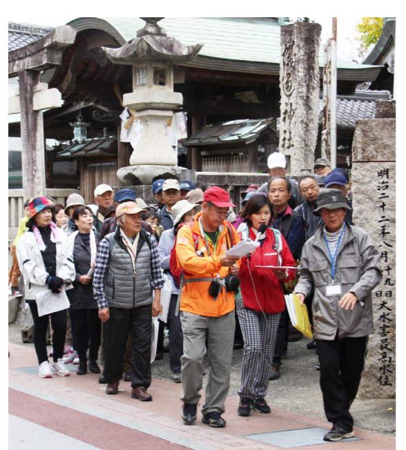
ラジオを聞きながら 市街地周辺を巡る

11月27日㊤、本宮行政局で第32回こだま祭が開催され、熊野牛などの飲食コーナーや紀州きのくに盆踊り愛好会のステージなどがありました。(20ページでも紹介しています。)