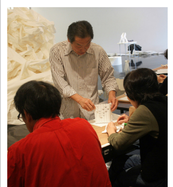
森の魅力を紙で表現

12月4日㊤、ラジオ&ウォーク「闘雞神社・南方熊楠の足跡を歩く」に約200名の方が参加。蟻通神社や高山寺などを巡る約6kmのコースを、ラジオから流れる実況を聞きながら楽しみました。