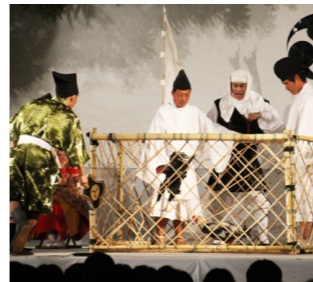
▲今年の演劇での一幕