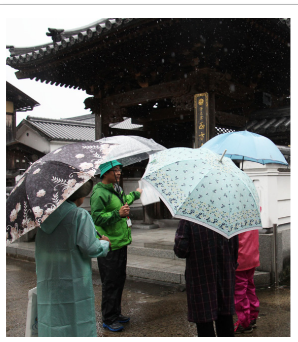
江川、古町の歴史に触れる

11月27日㊤、江川 かいわい 界限今昔巡りが開催されました。しとしと雨が降る中、参加者の方は、ガイドが説明する様々な時代の話に耳を傾け、驚いたり感心したりしながら江川、古町を巡りました。