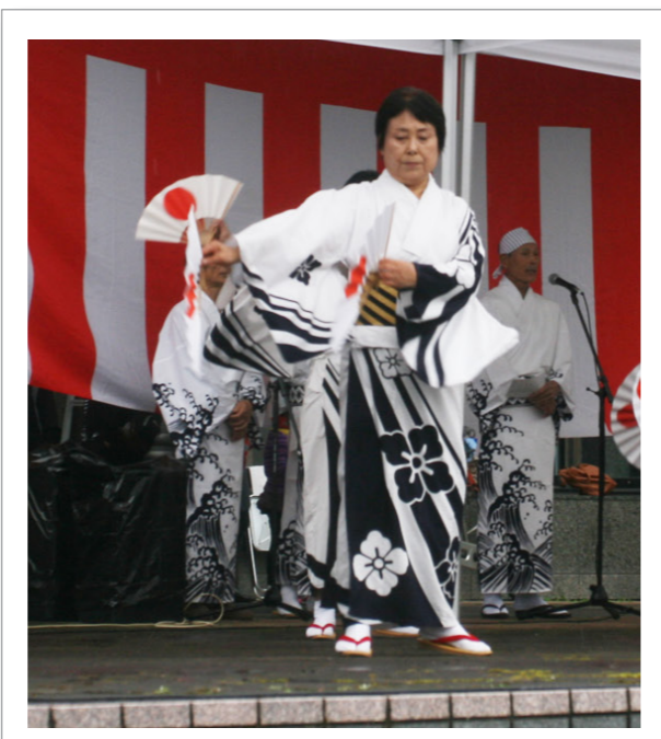
雨に負けず、 本宮の文化や恵みを満喫

11月27日㊤、江川 かいわい 界限今昔巡りが開催されました。しとしと雨が降る中、参加者の方は、ガイドが説明する様々な時代の話に耳を傾け、驚いたり感心したりしながら江川、古町を巡りました。