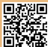
モバイル用ホームページ

場田辺広域休日急患診療所（市民総合センター玄関右側） ☎内科、小児科系、歯科の応急診療 日時 9時～11時30分、13時～16時 （※小児科のみ、⊕18時～21時30分も診療を行っています。） ☎0739-26-4909