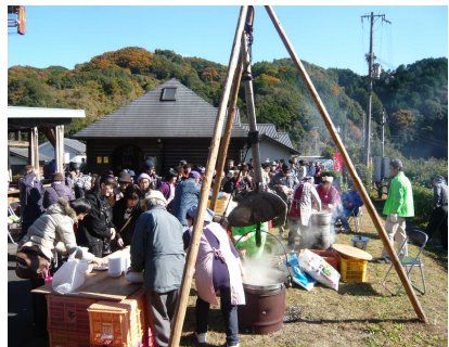
【茶がゆ・ボタン汁サービス】