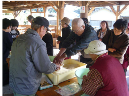
【秋津川産お米すくい】