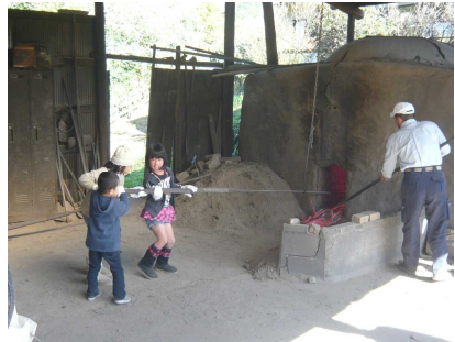
【備長炭の窯出し体験】