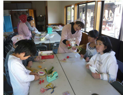
【しめ縄リース作り】