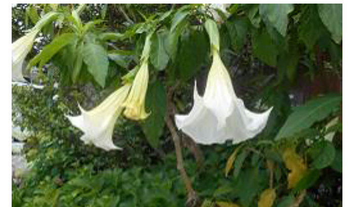
【トランペット 5月22日撮影】