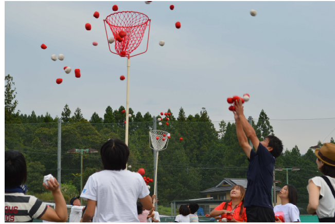
公民館の玉入れ競技