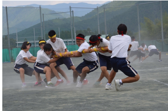
生徒たちの棒引き競技

本宮中学校では、9月13日（日）に体育祭を開催しました。生徒達は、赤・青・黄色の3ブロックに分かれて、応援合戦も含めて点数を競い合いました。3年生にとっては中学校生活最後の運動会です。競技だけでなく、運動会の運営も中心になって活躍しました。公民館では「玉入れ」と「綱引き」の2種目を各分館対抗で行いました。