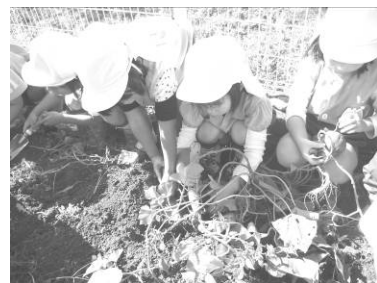
たくさんお芋が掘れたよ!!