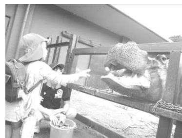
アドベンチャーワールドでかばさんにご飯をあげたよ!!