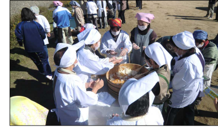
皆で分担して取り組みました