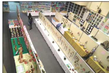
昨年(2022年)の作品展の様子