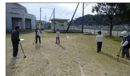
大小様々なコースを回りました