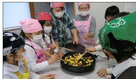
「大学イモをつくろう」

12月のふれあいスクールでは、7日に「ミニクリスマスツリーをつくろう!(全学年)」、14日に「ケーキのかざりつけ体験(2・4・5年生)」、21日に「ケーキのかざりつけ体験(1・3・6年生)」を実施する予定となっています。ご興味のある方はぜひ一度見に来てください。