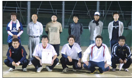
優勝の内ノ井チーム