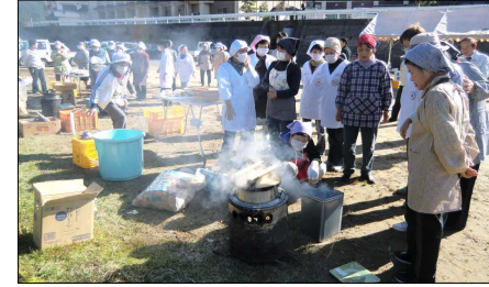
かまどを用いて炊き出し

午後は大塔総合文化会館において研修をおこない、大塔行政局の職員から台風の状況や行政の対応について説明を受けました。写真や資料を用いた説明を受け、参加者は被害の深刻さに驚くとともに、防災の重要性について改めて考えさせられた様子でした。