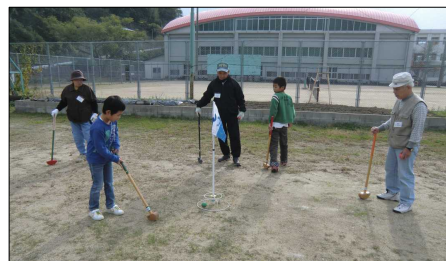
「グラウンドゴルフ大会に参加しよう」