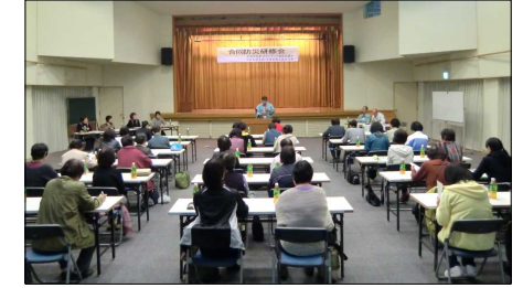
行政局職員からの説明