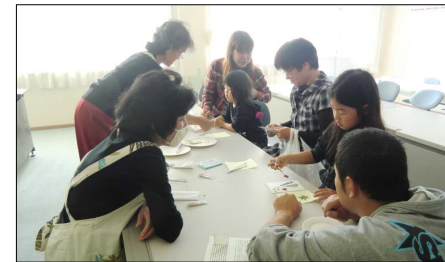
ふれあい体験教室(押し花)

お楽しみ会を締めくくる「餅まき」では、体育館前方・側方の3方から飛んでくるたくさんの餅に、会場内はとても盛り上がったとともに皆たくさん拾うことができ、来場者約480名は最後まで楽しんでいました。