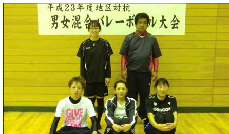
準優勝の内ノ井Aチーム

決勝戦は宇能越チームと内ノ井Aチームで行われ、宇能越チームが1セット目をとり優勢となると2セット目はさらに激戦となりましたが、21対16で宇能越チームが試合を制し優勝を飾りました。