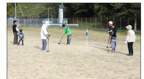
皆とても楽しそうでした