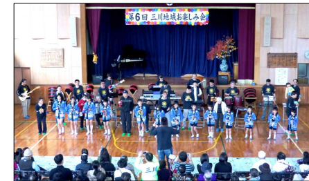
あすなる楽団と三川小学校児童の合同演奏