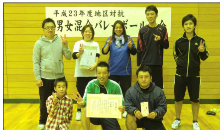
優勝の宇能越チーム