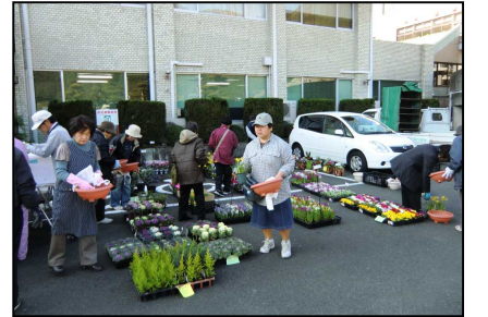
色とりどりの花の中から選びました