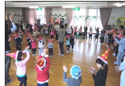
みんなでダンス(あゆかわ保育園)