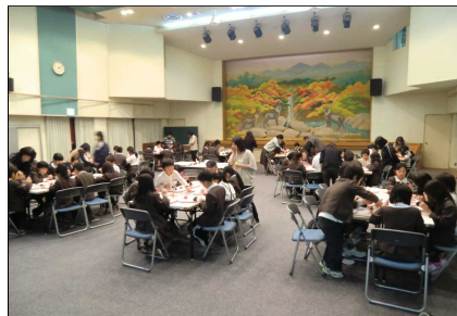
ミニクリスマスツリーをつくろう

平成24年1月のふれあいスクールでは、11日に「紙ブーメランを作ってあそぼう(1・2年生)」、18日に「茶道教室(3~6年生)」を実施する予定となっています。ご興味のある方はぜひ一度見に来てください。