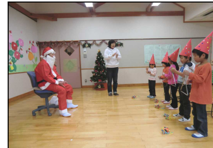
園児から歌のプレゼント(とみさと保育園)

サンタからのプレゼントは園児一人ひとりに手渡され、もらった園児は「ありがとう」とにっこり笑ってうれしそうでした。又、園児からサンタにもプレゼント(手づくりのカレンダー・手づくりのオブジェ)が送られ、サンタもとてもよろこんでいました。