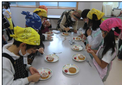
「ケーキのかざりつけ」2・4・5年生