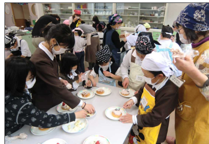
「ケーキのかざりつけ」1・3・6年生