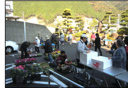
大塔総合文化会館駐車場で様子