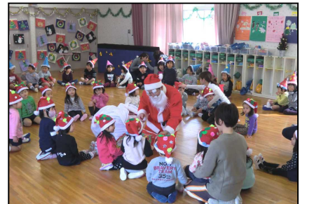
サンタからのプレゼント