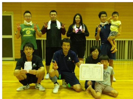
【バレーボール優勝 宇能越チーム】