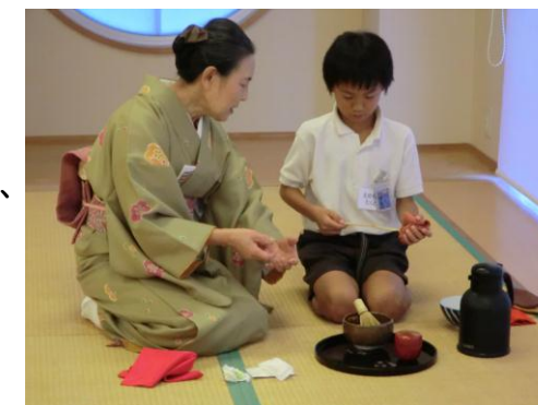
【伝統文化 茶道教室】