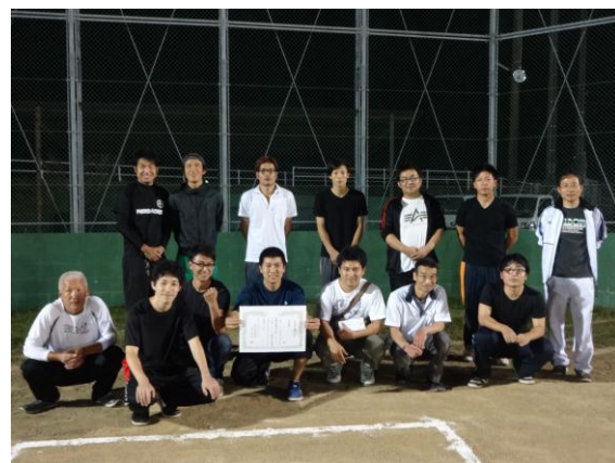
【準優勝：大塔あすなろ会チーム】