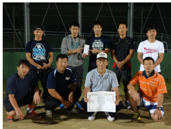
【優勝：中辺路大塔消防署チーム】

(中辺路大塔消防署、消防団大塔支団、大塔村商工会、大塔設備、JA紀南鮎川支所、大塔郵便局、田辺金属工業、大塔教職員、大塔あすなろ会、西牟婁森林組合)