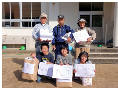
【小学生・一般の部の優勝~第三位の皆様】