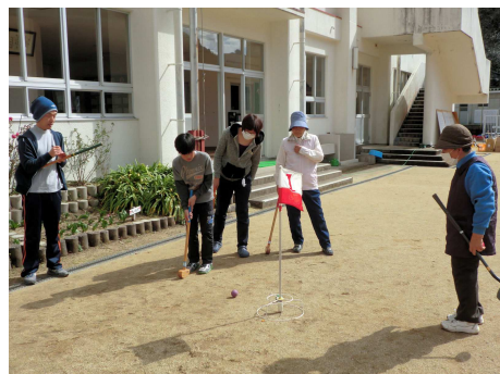
【温かい眼差しで子供を見守る大人たち】

※同スコアの場合、1打の数が多い者が上位に、それも同じ場合は2打の数で順位を決定しました。 なお、今回一般の部では、準優勝を決定するに当たって1打・2打ともその数が同数でした。