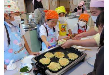
【ふれあいスクール】