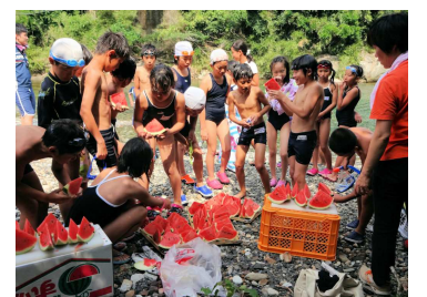
【チャレンジキャンプ】