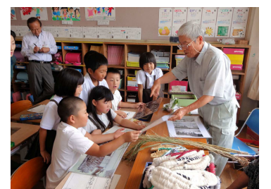
【昔の暮らし(地域住民が講師)】