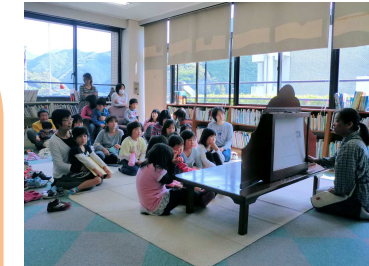
【絵本の読み聞かせ】

8月 盆球技大会(バレーボール大会) 9月 職場職対抗ソフトボール大会、地区対抗ソフトボール大会 10月 地区対抗バレーボール大会、子ども野球体験教室 11月 交流バレーボール大会、大塔グラウンドゴルフ大会 3月 富里グラウンドゴルフ大会