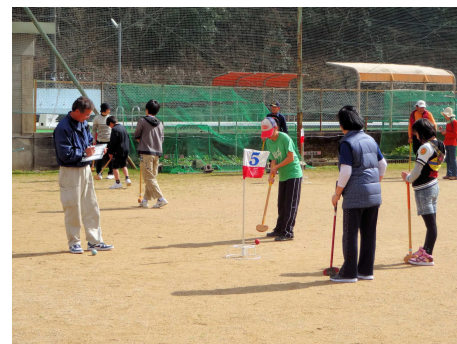
【グラウンドゴルフを楽しむ参加者】