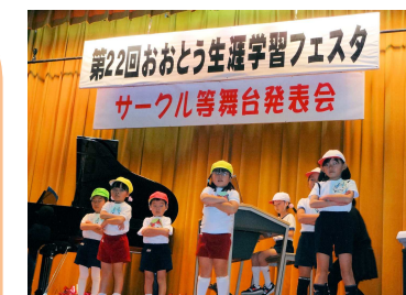
【フェスタ舞台発表】

7月 三小学校(鮎川・富里・三川)と公民館共催の「チャレンジキャンプ」 11月 三川小学校を中心とした「三川地域お楽しみ会」、小中学生と地域による清掃活動「大塔リフレッシュ大作戦」ほか。