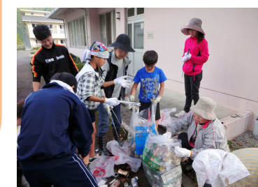
【リフレッシュ大作戦】