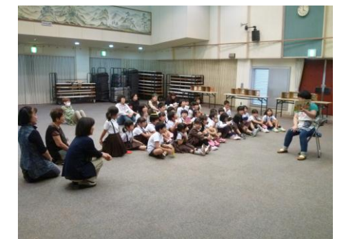
【絵本の読み聞かせ】