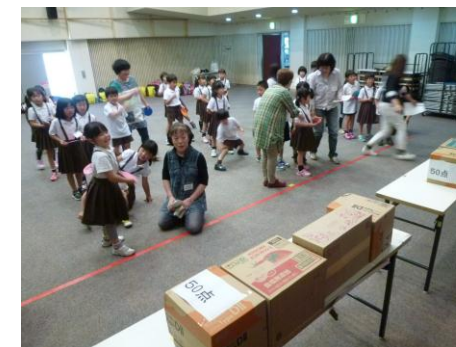
【エコディスク飛ばしゲーム】