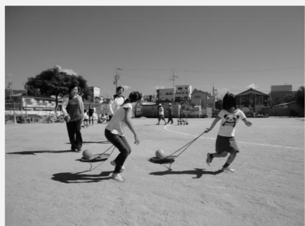
親子で協力 ざるひき競争