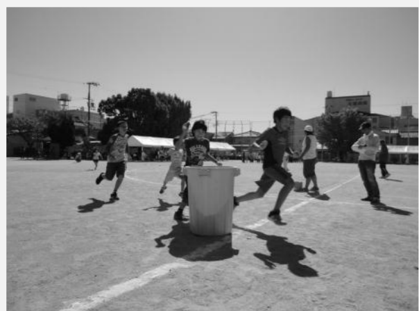
元気いっぱいの小学生

運動会開催にご協力いただいたみなさん、ご参加いただいたみなさん、本当にありがとうございます。