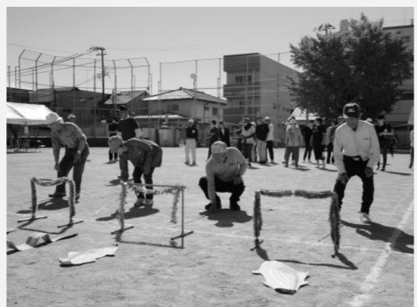
最高齢93歳も参加 さかなつりレース