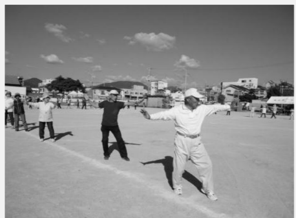
最後は恒例の弁慶おどり