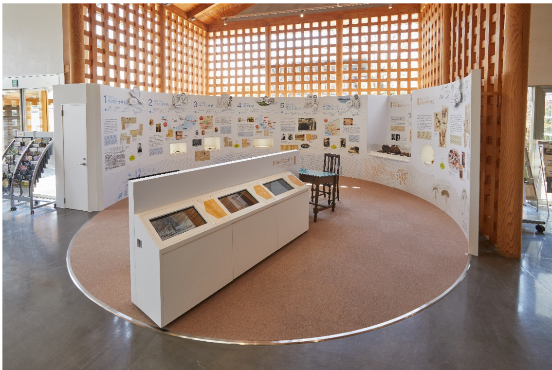
南方熊楠顕彰館 常設展示リニューアル