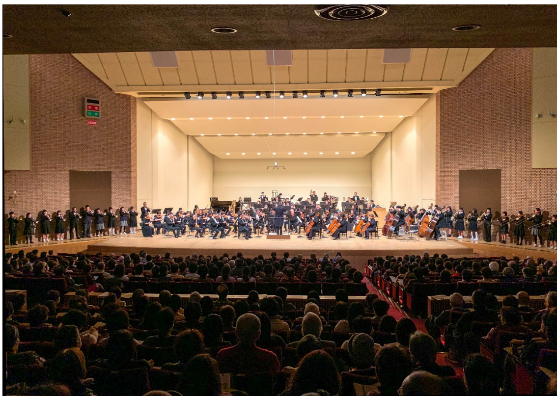
大阪交響楽団名曲セレクション 2019