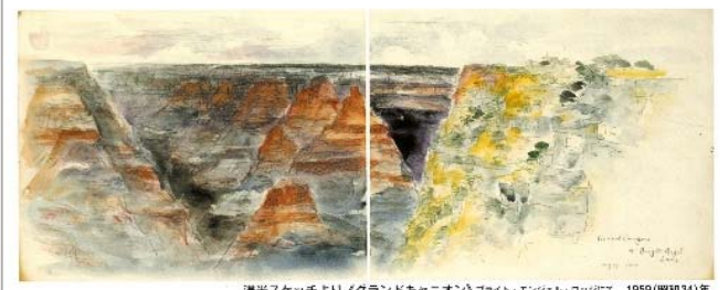
渡瀬スケッチより《グランドキャニオン》ブライト、エンジェル、ロケット 1959(昭和34年)