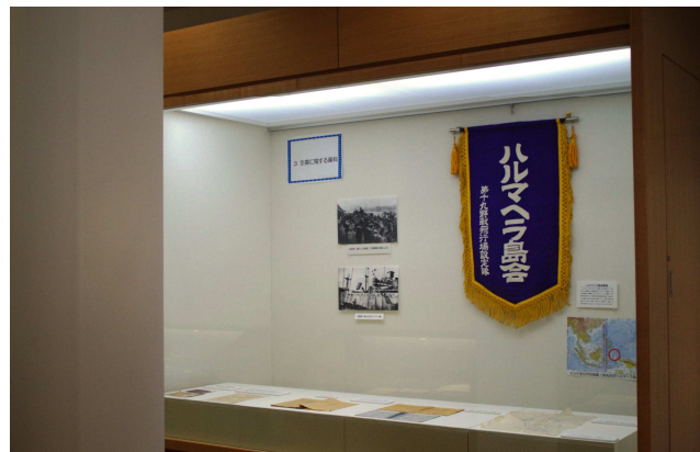
引揚に関する資料