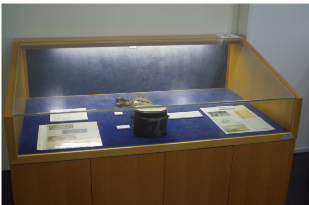
戦地での生活用品