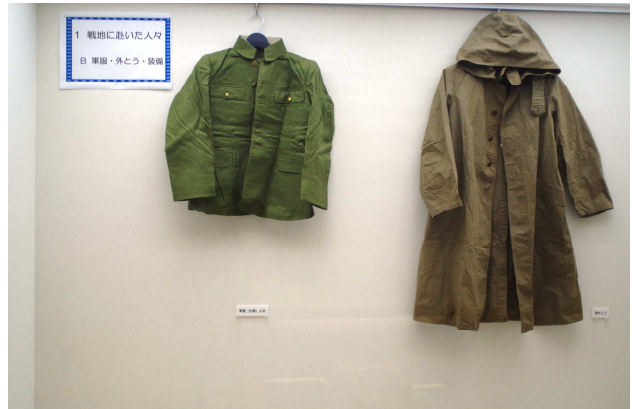
軍服・外とうなど