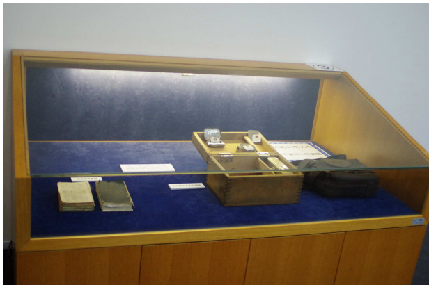
戦地で使用した道具類