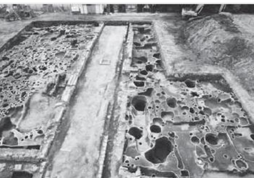
新宮城下町遺跡 (新宮市)