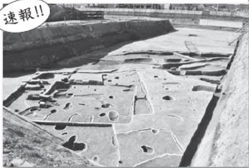
田屋遺跡 (和歌山市)