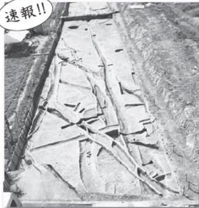
川辺遺跡 (和歌山市)