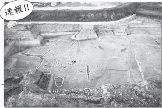
粟島遺跡 (紀の川市)