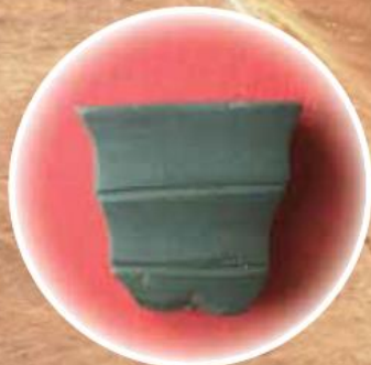
東城跡出土 琴柱形石製品