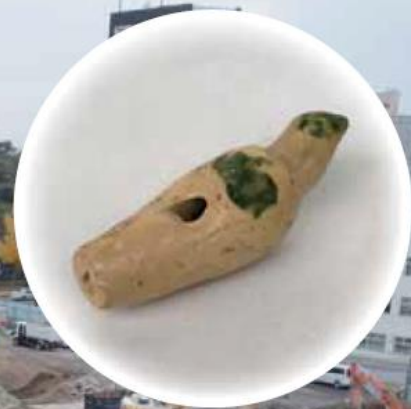
和歌山城跡出土 鳥笛