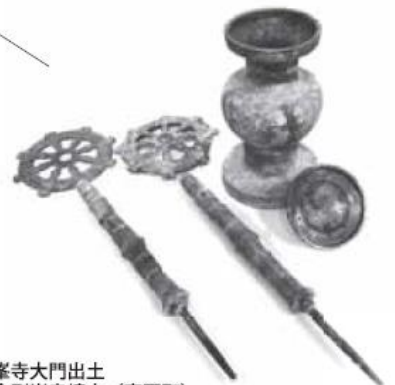
金剛峯寺大門出土 史跡金剛峯寺境内 (高野町)