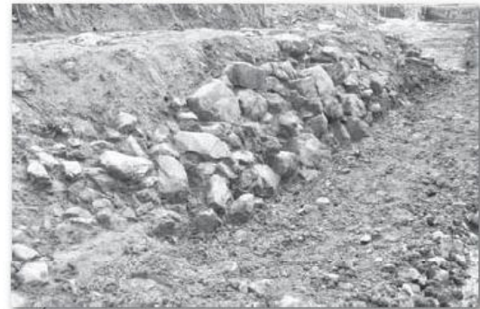
根来寺遺跡 (岩出市)