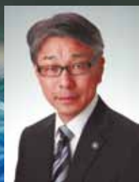
真砂充敏田辺市長