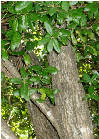
市の木『うばめがし』

うばめがしは、海岸沿いから山間部までこの地に広く自生しており、荒地や傾斜地でも生育する力強さを持ち、名高い備長炭の原木として知られています。