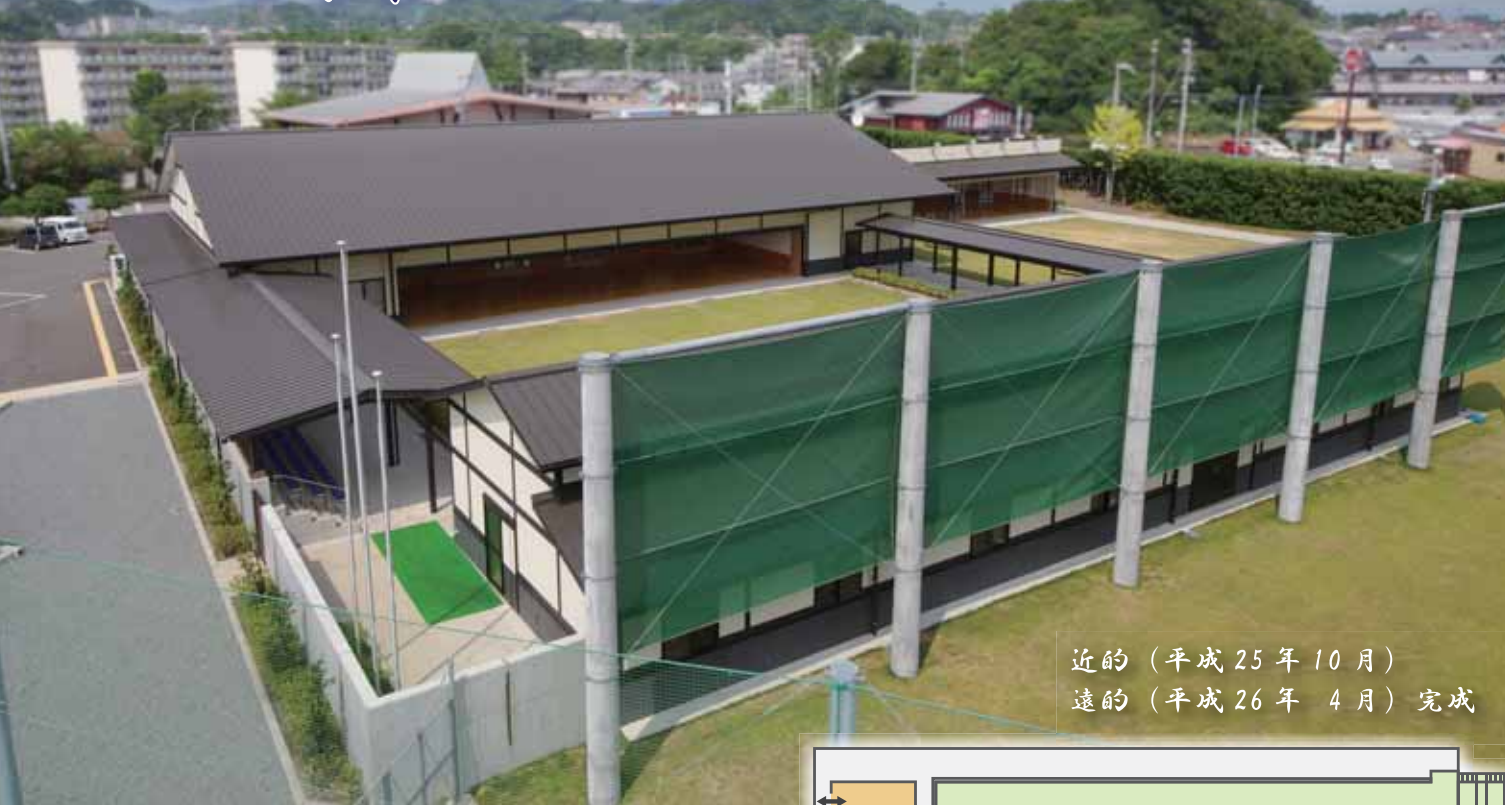
近的 (平成 25 年 10 月) 遠的 (平成 26 年 4 月) 完成