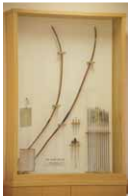
右) 和佐大八郎範遠の使用した弓矢 (道場内に常設展示) 三十三間堂通し矢で使用されたと伝えられている弓