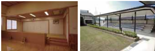
▲ 近的射場・審判席