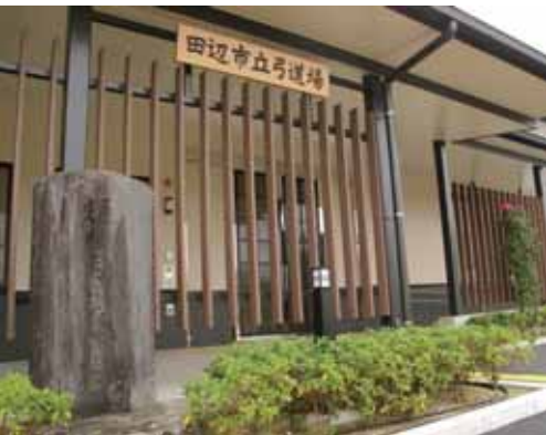
左) 弓道場入口に建てられている「弓道達人・和佐大八郎範遠 顕彰碑」 * 紀伊国紀州藩の弓士・京都三十三間堂通し矢天下第一 (8,133 本, 1686 年) 市内の浄恩寺 (田辺市古尾 25-12) に墓所がある