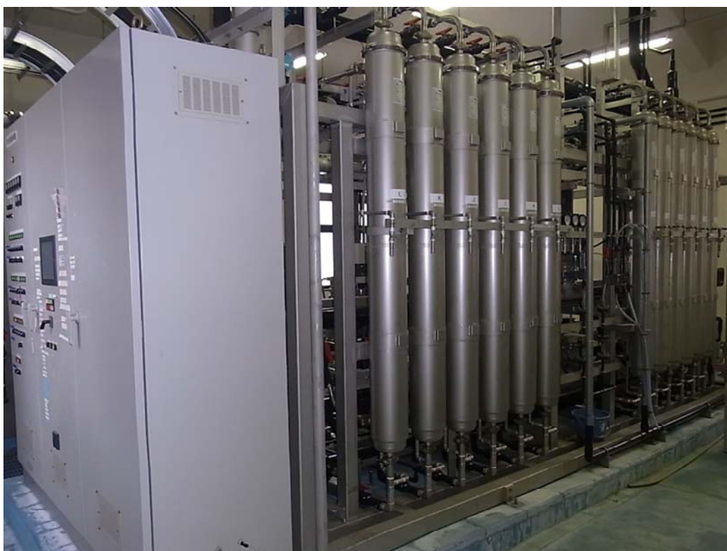
【渡瀬浄水場膜ろ過施設】

逆浸透膜、限外ろ過膜、精密ろ過膜、イオン交換膜、透析膜などにより水中の不純物を分離する処理方法です。原水をこれらの膜に通すことで清浄な水を得ることができます。