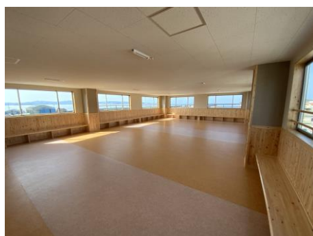
室内避難スペース