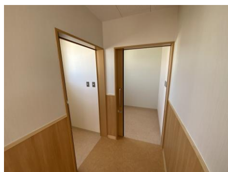
簡易トイレスペース