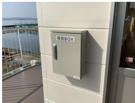
感震ボックス（震度5弱で解錠）