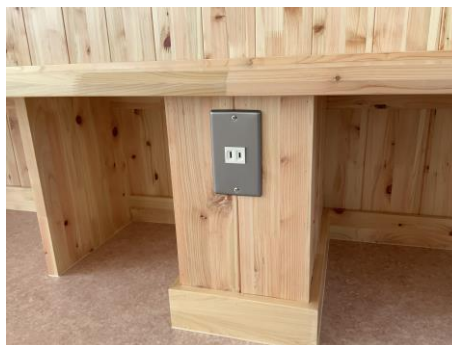
電源コンセント（蓄電式）