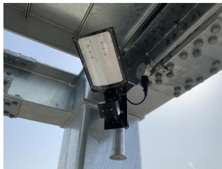
センサー式避難誘導灯（蓄電式）