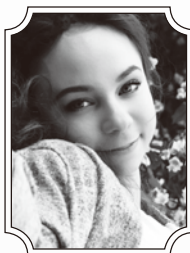
マリア・シュピロワ