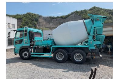
夏に向け生コン車も カバーを付けました。

工事期間中は、何かとご迷惑をおかけしますが、 ご理解、ご協力をよろしくお願いいたします。