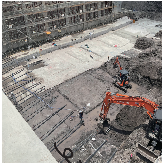
庁舎棟基礎の掘削工事中です