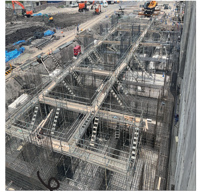
庁舎棟基礎の鉄筋工事も進捗中