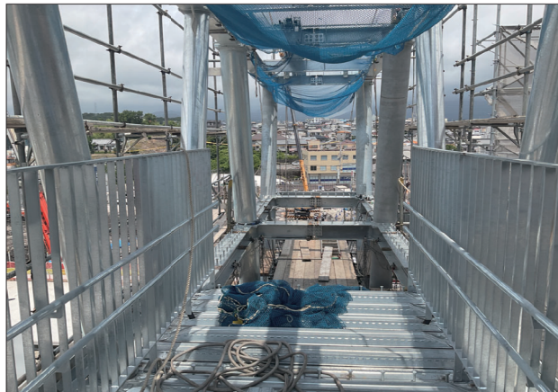
歩道橋通路部分の様子