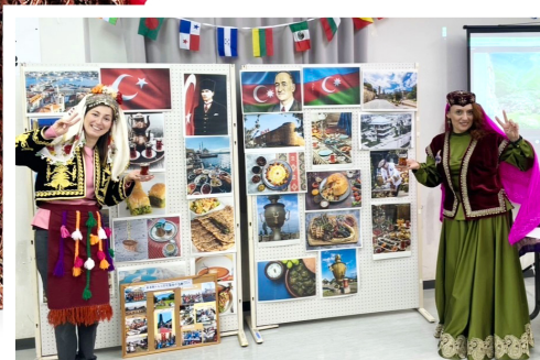
▲歴史と心でつながる兄弟国