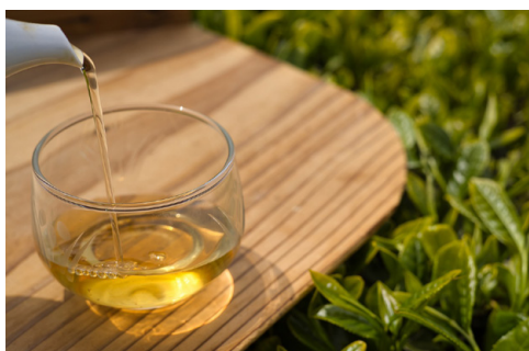
▲地域でも有数の茶園として、その味と文化を受け継いでいます。