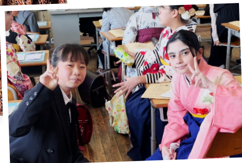
友達と袴姿でパチリ