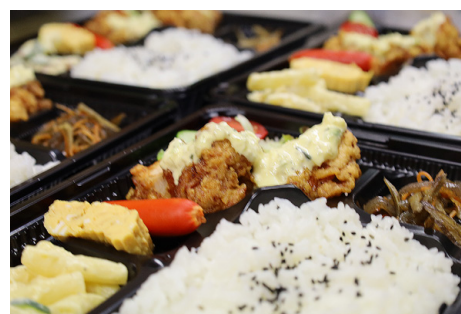
チキン南蛮弁当。真っ赤なウィンナーと卵焼きは欠かせない。