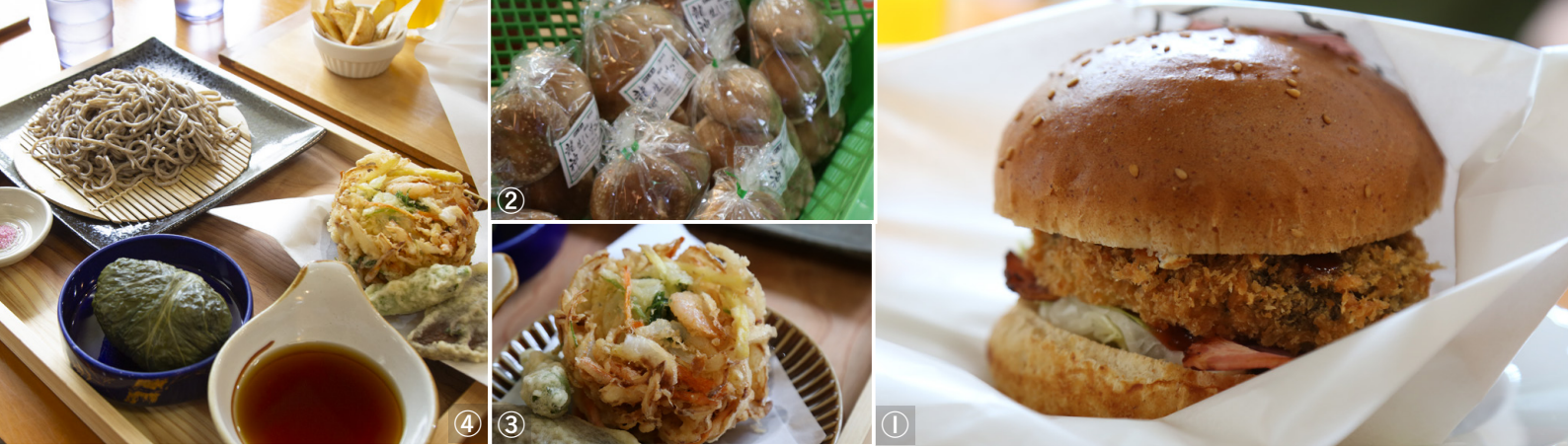
①大きなパンズに引けを取らない龍神しいたけは、フライにしている ②龍神しいたけをはじめ館内で地域産品が購入できる ③④数量限定の天ざるそば。かきあげにしいたけの天ぷら梅肉添えと、村内産のインゲン等の季節野菜の天ぷらが付き、夏は売り切れ必至。※めはり寿司は別注文