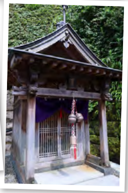
龍神温泉街で、龍神温泉にまつわる歴史に触れてみるのも