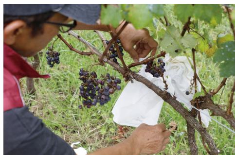
▲ブドウは一つ一つ袋をつけ、甘くなるまで大切に育てます。