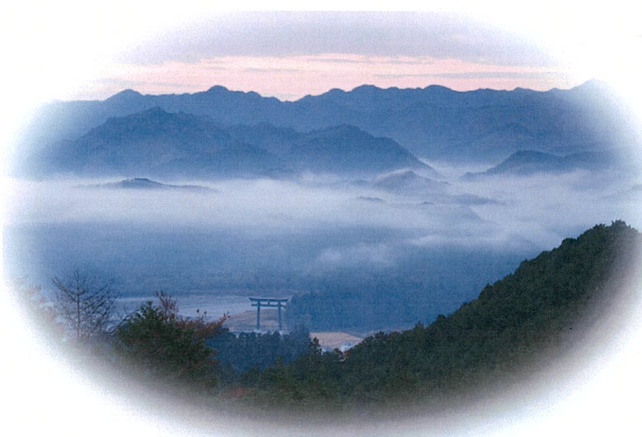
大斎原（熊野本宮大社旧社地）

1969年（昭和44年）福岡県の寺院 切幡寺（きはたじ）に生まれる。 （切幡寺 = 篠栗八十八ヶ所霊場 第十番札所）1993年（平成5年）高野山大学卒業。1994年（平成6年）より高野山金剛峯寺に奉職。2011年（平成23年）切幡寺住職に就任。2021年、総本山金剛峯寺執行長公室長、高野山真言宗宗務総長公室長（現 高野山執務公室長）、2023（令和5年）5月14日～7月9日に執り行われた宗祖弘法大師御誕生1250年記念大法会では事務局長として記念事業を遂行。また2024年（令和6年）12月19日NHK「ラジオ深夜便」に出演し、「世界遺産20年 自然と一体になれる聖地・高野山」のテーマで2024年に「紀伊山地の霊場と参詣道」が世界遺産登録20年を迎え、高野山が全世界から人々を引き寄せるものは何か、そして改めて感じたい弘法大師空海の考えは何かを熱く語った。