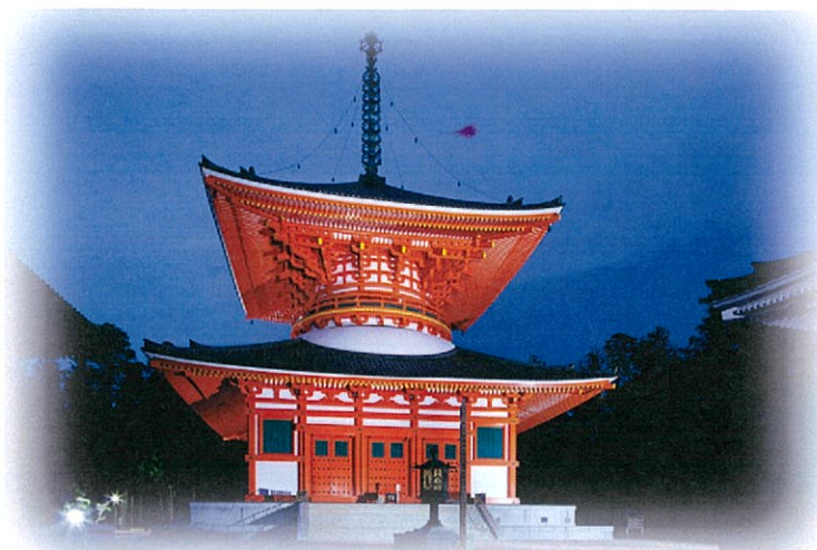
壇上伽藍 根本大塔（高野山）