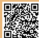
全国版救急受診ガイド 「Q助」