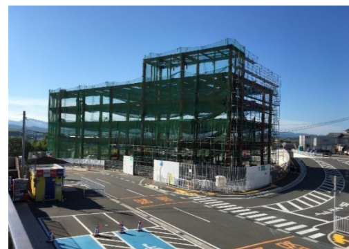
▲令和2年6月23日 鉄骨工事状況

店舗・駐車場棟の整備状況について オークワ社が施主となって整備を進めている店舗・駐車場棟(1階店舗、2階店舗駐車場、3階屋上市役所公用車等駐車場)について、令和2年1月20日より工事に着手しており、現在鉄骨工事を行っています。 今後、8月中旬頃に鉄骨工事が完了予定となっており、引き続き、床のコンクリート工事、外壁工事、内装工事を行い、工事完成は令和3年2月、オークワ社の店舗開業は令和3年3月の予定です。