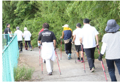
▲ノルディックウォーキング

運動を楽しみたい方を対象として、誰でも気軽に楽しめるニュースポーツの指導、体験教室を開催します。 ◎各日とも30名「先着」 ◎飲み物・室内用運動靴（屋外実施時は屋外用運動靴）・運動のできる服装・タオル等 ◎左記へ電話又は参加申込書に住所・氏名・年齢・電話番号をご記入の上、FAX・Eメールでお申し込みください。 ◎スポーツ振興課 市民スポーツ係（田辺スポーツパーク管理事務所内） ☎0739（25）2531 ☎0739（25）0387 ✉sports@city.tanabe.lg.jp