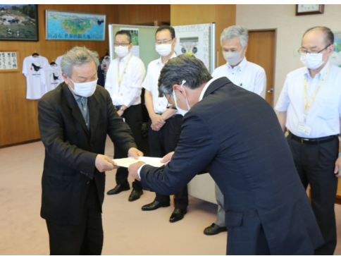
▲報告書提出の様子

報告書の詳しい内容や委員会の会議録は、ホームページで閲覧できます。 ☐ https://www.city.tanabe.lg.jp/choshaseibi/hatyu_houhou.html ※JV(ジョイントベンチャー)とは、複数の建設企業が一つの建設工事を受注、施工することを目的として形成する共同企業体のことです。