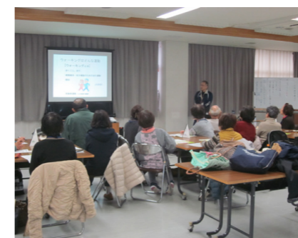
▲理学療法士による講話

誰でも簡単に運動習慣を身に付けられるよう、活動量計を使った「速歩き健康塾」を開催します。 ◎糖尿病や高血圧の予防に効果があると言われていた1日8000歩、20分の速歩きを体験してみませんか。皆さん気軽にご参加ください。 ◎9月4日(金)、9月11日(金)、10月2日(金)、10月30日(金) ◎13時30分～15時30分（受付は13時） ◎市民総合センター4階「交流ホール」 ◎速歩き健康法について（活動量計を実際に使ってみよう） ◇速歩き体験 ◇理学療法士による「ウォーキングについて」の講話と実技（食事について考えよう・ストレッチなどの室内運動） ◎ウォーキングを続けていけるようサポートします。 ◎市内に住民票がある40歳～74歳の運動可能な方 ◎原則4回とも参加できる新規お申込みの方を優先します。 ◎20名「先着」