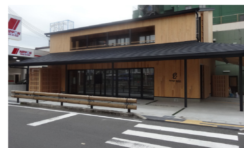
▲ tanabe en+ 外観

市では、国の「景観まちづくり刷新モデル地区」の指定を受け、平成29年度より、「世界遺産のまち田辺市」の玄関口にふさわしい、賑わいのある商店街づくりをめざすとともに、世界遺産「闘雞神社」へ通じる商店街として景観に配慮した外観修景に取り組み、魅力的な商店街へとするため、駅前商店街外観修景整備及び市街地活性化施設整備等の田辺市景観まちづくり刷新支援事業を実施してきました。 この度、JR紀伊田辺駅前に整備していましたが、田辺市市街地活性化施設【愛称】「tanabe en+」が8月10日(祝)の10時にオープンします。 本施設は、街なかの情報発信や起業・創業支援など来訪者と市民の多様な交流機会の創出を図り、地域経済の活性化につなげることを目的に整備しており、施設の1階は田辺の魅力ある地域産品を紹介するプロモーションカフェ、2階は起業・創業に関するセミナー