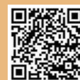
全国版救急受診ガイド「Q助」