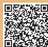
防災行政メール等